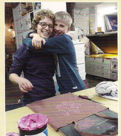
Ein Tagesbesuch der Behindertenpfadfindergruppe in einer Siebdruckwerkstatt