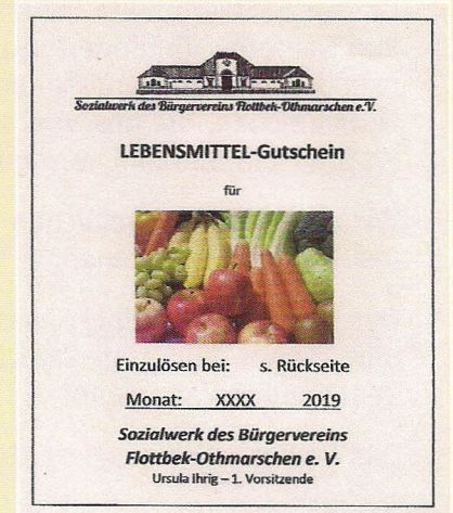
... wird an bedürftige Einzelpersonen ausgegeben